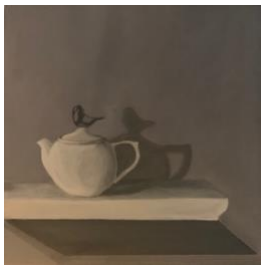
We're Together In This, March, 2020 30x30 cm Acrylic on canvas