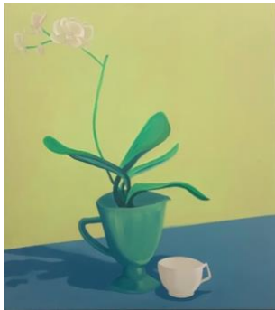
I Rationed With Caution, 2020 Acrílico sobre tela 90x80 cm