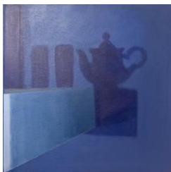
Back To Blue, March, 2020 25x25 cm Acrylic on canvas