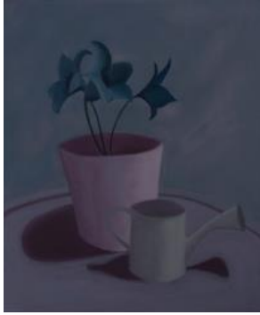
Noche, 2017 60 x 50 cm acrílico sobre tela