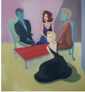
Conversation in Milton's Studio, 2017 120 x 110 cm acrílico sobre tela