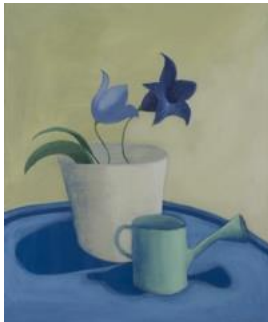
Día, 2017 60 x 50 cm acrílico sobre tela