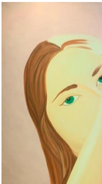
Because Of The Notion, 2019 Acrílico sobre tela 120x90 cm