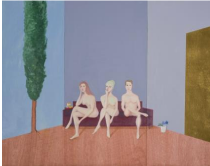
Three In Grace, 2019