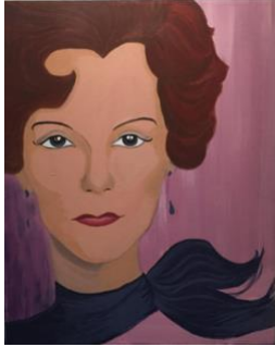
Hacia el país de las maravillas, 2016 100 x 80 cm acrílico sobre tela