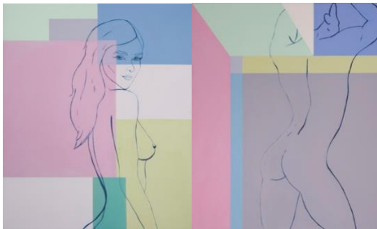
In A World of Confusion Love As The Answer And If You Ask Love Is love No Matter What Love Always Wins, 2019 120 x 200 cm Acrílico sobre tela