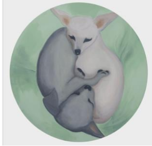
Balance, 2018 70cm diámetro acrílico sobre tela